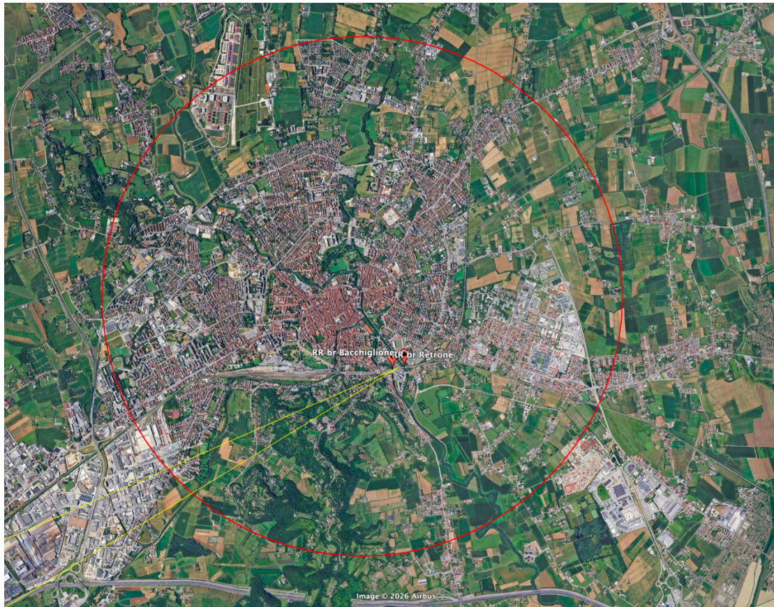
Figura 2 - Il cerchio rosso indica il raggio di due miglia dal centro di Vicenza (Google Earth).