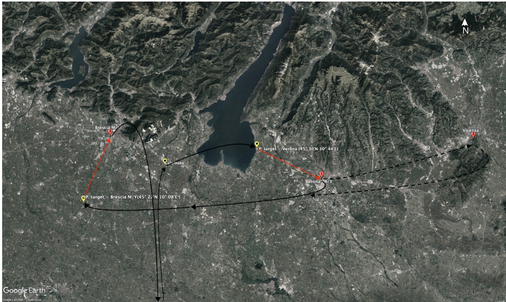
Figura 1 - Vicenza target.